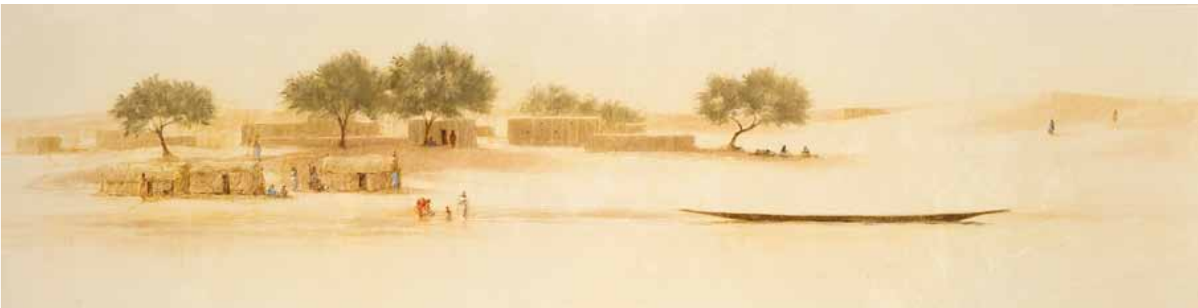
■ El río entre dunas - 50x200 cm - Technique mixte sur toile