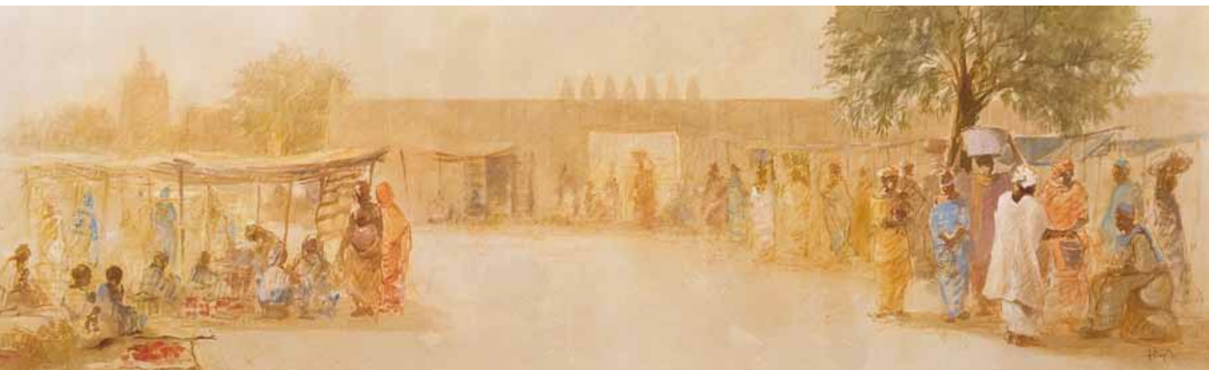
■ Mercado en Djenne - 37x122 cm - Technique mixte sur toile