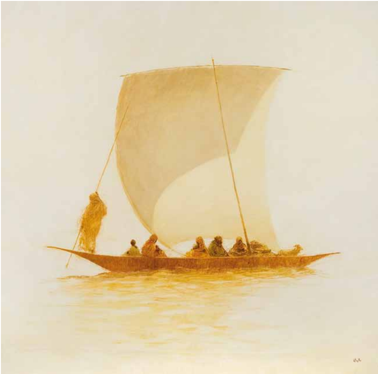
■ Djoliba - 200x200 cm - Technique mixte sur toile