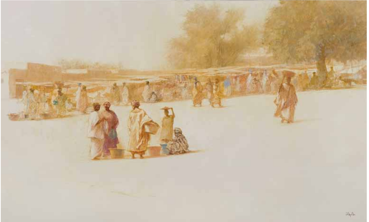
■ Marché à Danga - 89x146 cm - Technique mixte sur toile