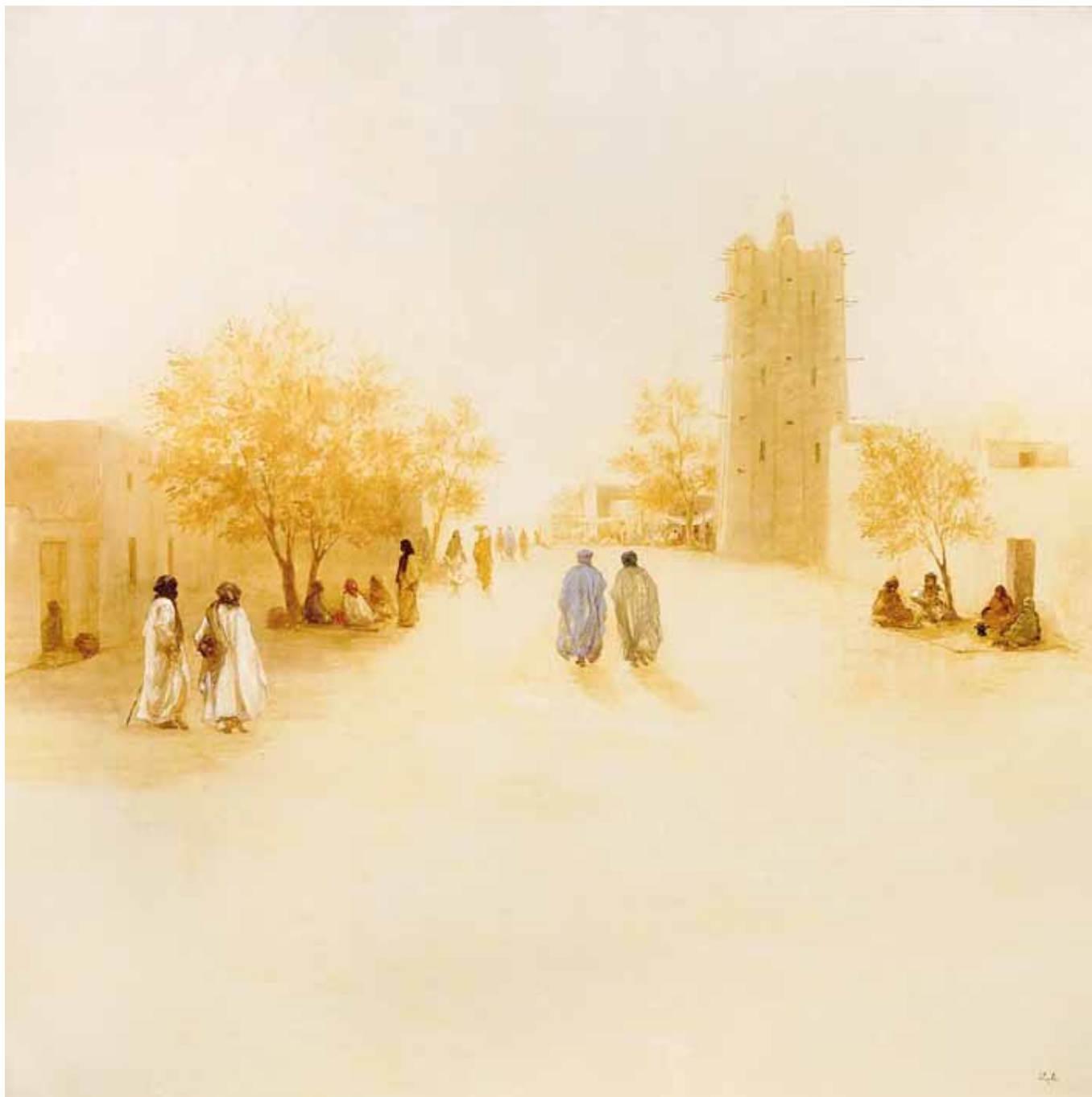
Le matin à Tombouctou - 200x200 cm - Technique mixte sur toile