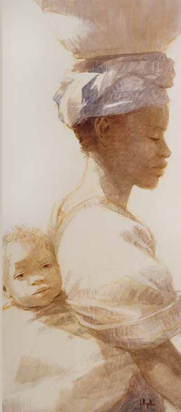
■ Maternidad - 70x30 cm Technique mixte sur toile