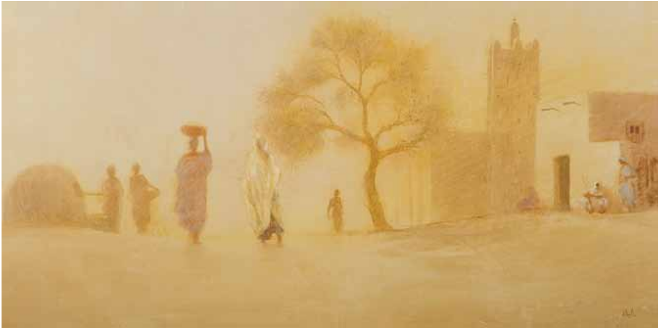
■ L'or du Mali - 65x130 cm - Technique mixte sur toile