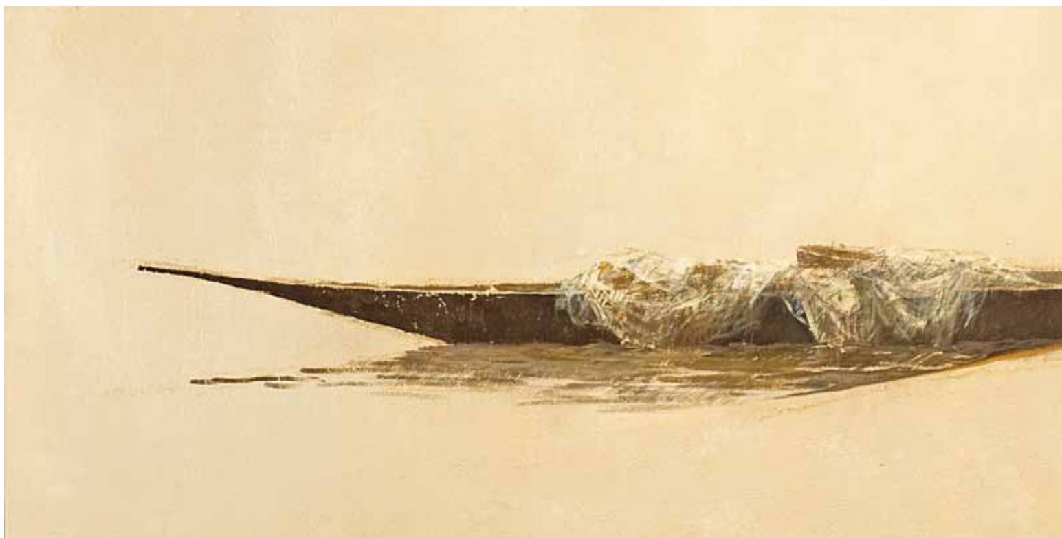
■ Pinasse - 50x200 cm - Technique mixte sur toile