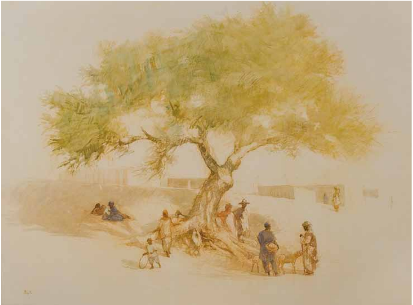
■ L'arbre sacré - 97x130 cm - Technique mixte sur toile