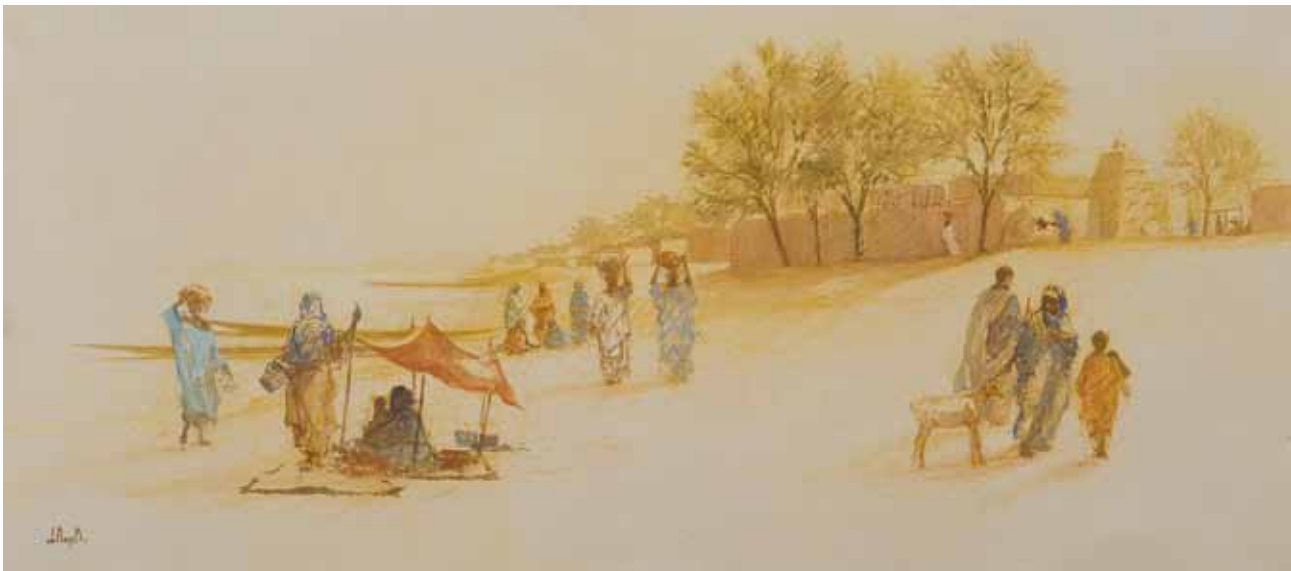
■ Hijos de la tierra - 35x80 cm - Technique mixte sur toile