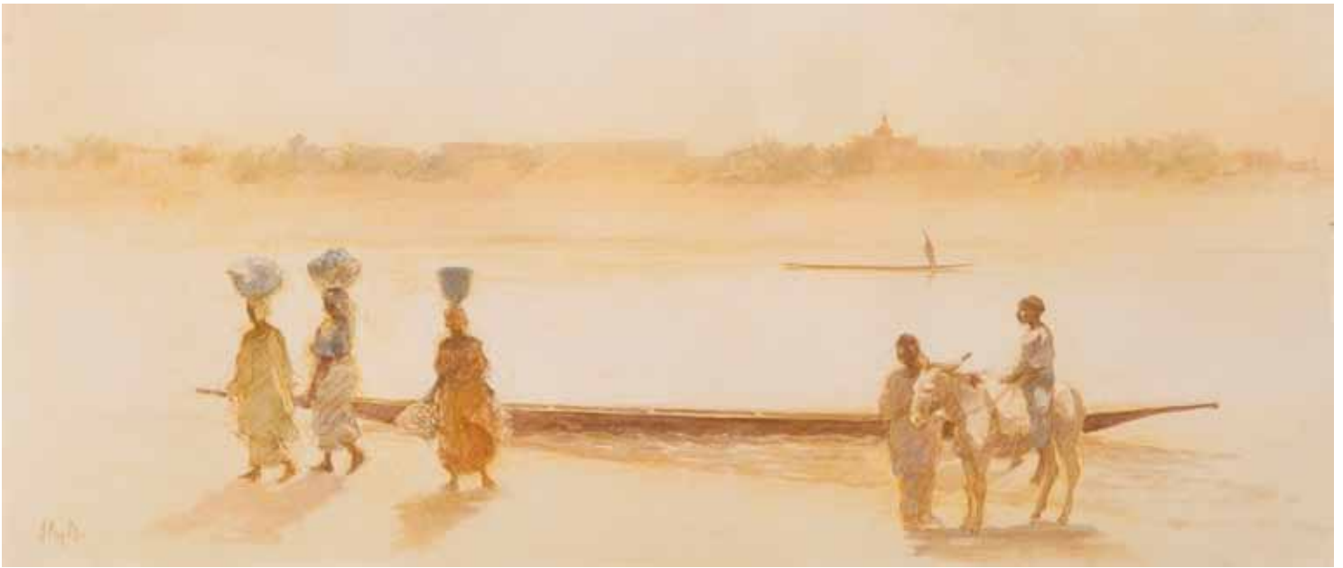
■ Kirchamba - 30x70 cm - Technique mixte sur toile