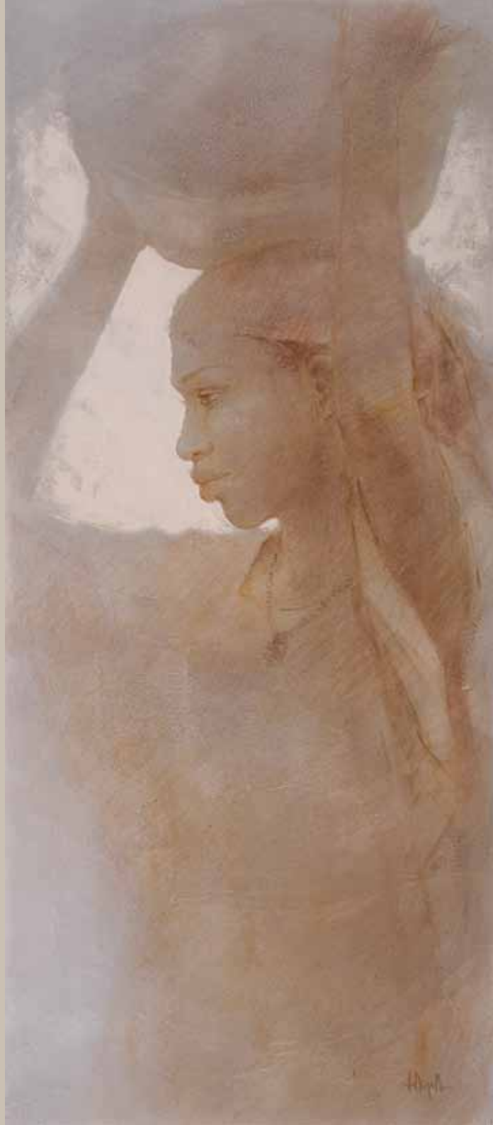
■ La jeunesse - 85x30 cm Technique mixte sur toile