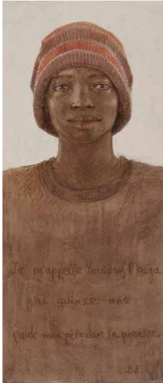
■ Youssouf Maiga - 70x30 cm Technique mixte sur toile