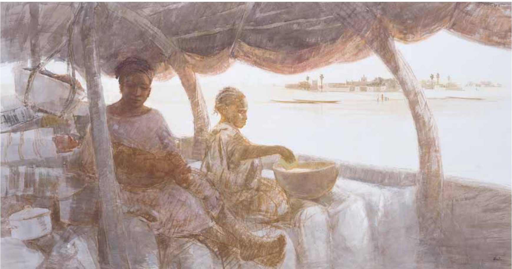
■ Dans la pinasse - 97x195 cm - Technique mixte sur toile