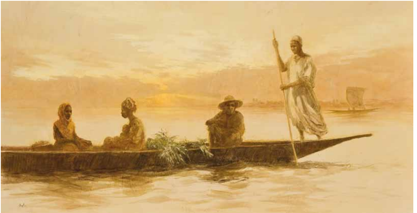
■ Atardecer - 97x195 cm - Technique mixte sur toile