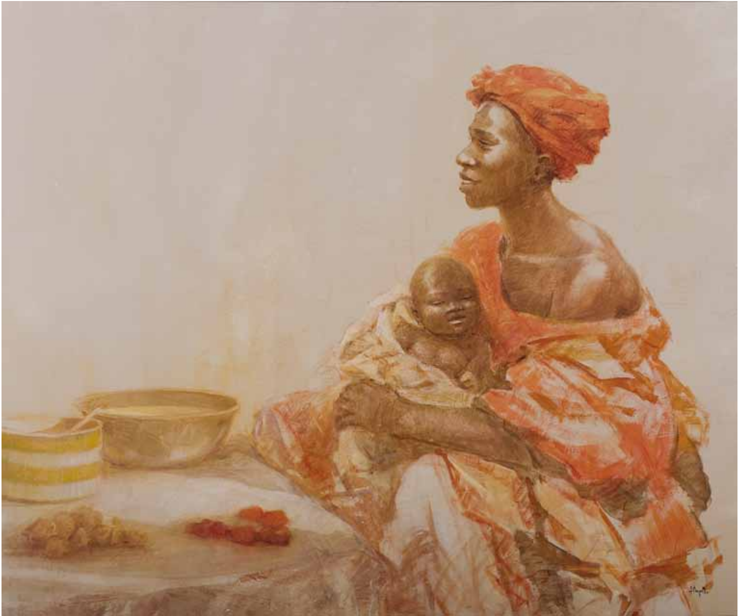
■ Isabelle - 85x105 cm - Technique mixte sur toile