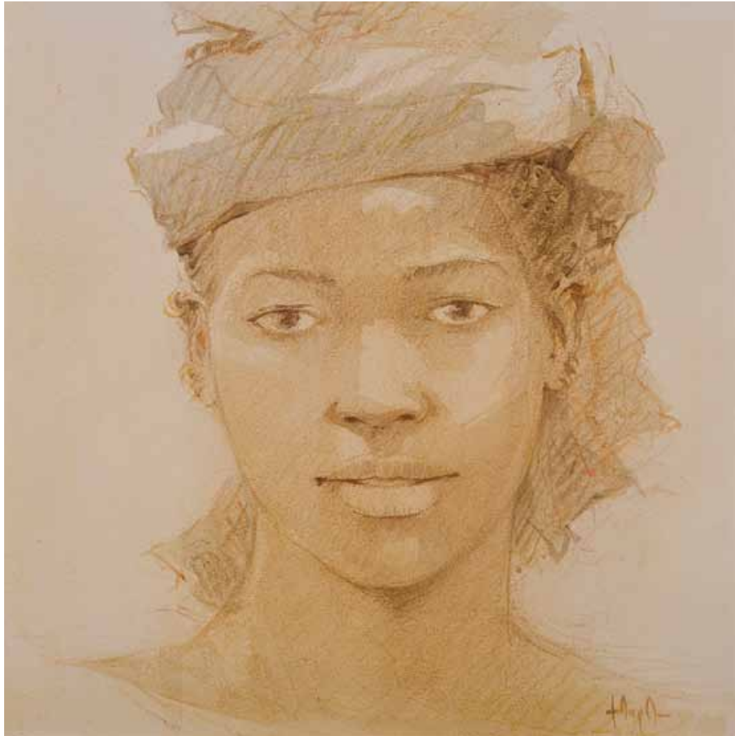
■ Joven - 30x30 cm - Technique mixte sur toile