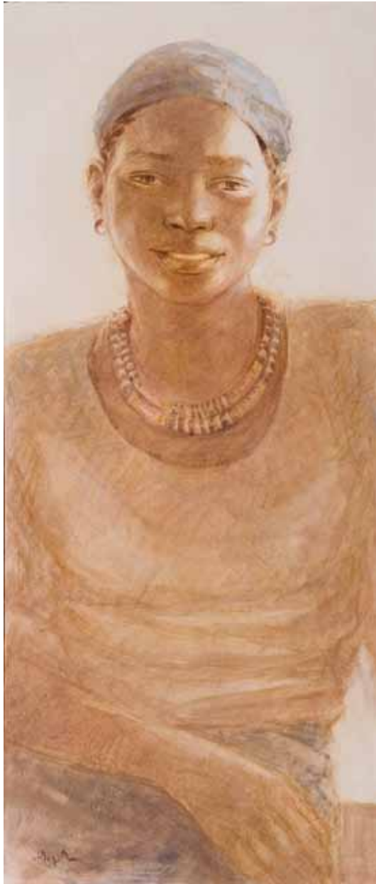
■ Aissatou Maiga - 70x30 cm Technique mixte sur toile